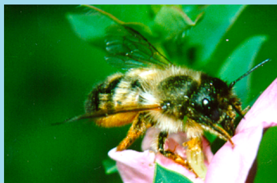
Osmia rufa.

nismi in molti modi: a volte l'uomo non se ne rende conto, almeno fino a quando una particolare specie o comunità rischia di scomparire o scomparire del tutto!