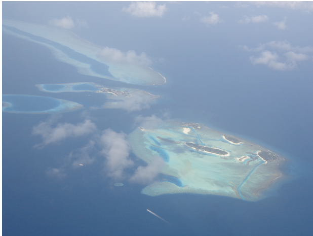
Isole Maldive, vista aerea

terie in campi agricoli sono i due esempi più ovvi di distruzione di habitat. Oggi le foreste coprono solo metà dell'area che coprivano un tempo e la foresta primaria, ovvero quella di vecchia crescita, dalla cui struttura e risorsa dipendono molte specie, è ridotta solo a 1/5 della superficie che occupava in passato. Gran parte delle praterie più produttive e ricche di specie sono state convertite in aree agricole o pascolative, anche a causa dell'espandersi della popo-