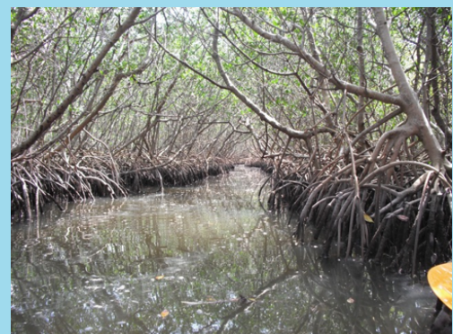
Foresta di mangrovie presso l'isola di Honeymoon, Dunedin, Florida.

Il quarto esempio ha a che vedere con l'importanza di ecosistemi forestali nella regolazione dei flussi d'acqua. Le foreste e le aree umide hanno un impatto sulla capacità di assorbimento in caso di inondazioni e piene. Alcuni ecosistemi forestali agiscono come spugne, intercettando precipitazioni attraverso il loro sistema di radici. L'acqua è raccolta nei suoli porosi delle foreste, e poi è lentamente rilasciata nelle acque di superficie e profondità. Attraverso questi processi, le foreste ricaricano le loro scorte d'acqua, mantengono i fiumi ad un livello normale e ne abbassano i picchi durante copiose precipitazioni o piene. Scendendo dalle foreste agli alberi, possiamo osservare come ogni singolo albero fornisce l'habitat alle piante e specie animali che vi vivono. Essi offrono una serie di beni naturali: spazio per vivere e riposare, mangiare foglie e frutti, cacciare le prede, deporre le uova nei nidi e scavare tane nel loro tronco e nelle loro radici.