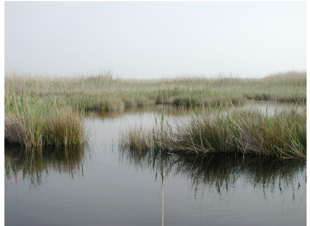
Torre Guaceto, Salento Italia

I sistemi ecologici in cui si dispiega tutta la complessità del nostro pianeta, devono, però, "conservarsi" per mantenere la loro ricchezza; conservare la biodiversità, quindi la ricchezza, significa innanzitutto evidenziare l'esistenza di tre componenti interne al concetto di biodiversità: