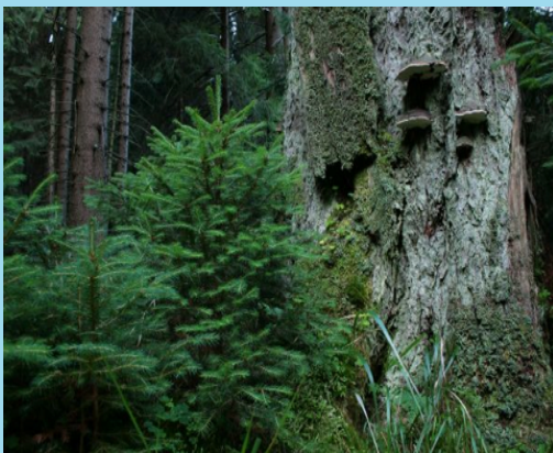
Foresta di abeti.

Il quarto esempio ha a che vedere con l'importanza di ecosistemi forestali nella regolazione dei flussi d'acqua. Le foreste e le aree umide hanno un impatto sulla capacità di assorbimento in caso di inondazioni e piene. Alcuni ecosistemi forestali agiscono come spugne, intercettando precipitazioni attraverso il loro sistema di radici. L'acqua è raccolta nei suoli porosi delle foreste, e poi è lentamente rilasciata nelle acque di superficie e profondità. Attraverso questi processi, le foreste ricaricano le loro scorte d'acqua, mantengono i fiumi ad un livello normale e ne abbassano i picchi durante copiose precipitazioni o piene. Scendendo dalle foreste agli alberi, possiamo osservare come ogni singolo albero fornisce l'habitat alle piante e specie animali che vi vivono. Essi offrono una serie di beni naturali: spazio per vivere e riposare, mangiare foglie e frutti, cacciare le prede, deporre le uova nei nidi e scavare tane nel loro tronco e nelle loro radici.