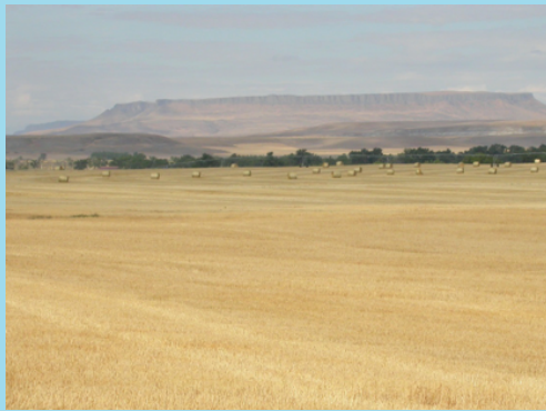
Campi di grano hanno trasformato profondamente il paesaggio del Montana.

Il secondo esempio tratta l'importanza della diversità genetica attraverso l'esempio delle colture.