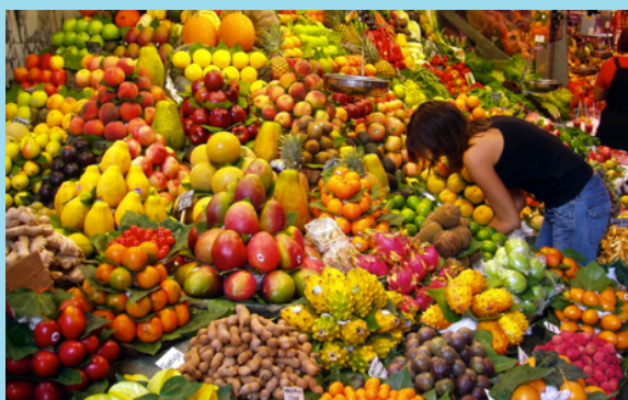
Un banchetto al mercato della frutta di Barcellona, Spagna.

Guardate il mercato! Quanto cibo lì! Sapevate che dobbiamo la maggior parte di tutto ciò alle api laboriose e alle loro sorelle selvatiche? Gli animali impollinano approssimativamente l'80% delle piante con fiori; i più grandi impollinatori sono insetti, in particolare le api. Quando si nutrono questi animali spostano il polline da un fiore all'altro, in questo modo le api e gli altri impollinatori ci forniscono una grande varietà di cibo (la maggior parte dei prodotti ortofrutticoli). Molte specie di api sono in pericolo! I loro habitats sono continuamente distrutti a causa dell'agricoltura, edilizia o avvelenate da pesticidi. Preservare la diversità delle api e delle piante che impollinano è oggi una questione centrale per ricercatori e decisori politici.