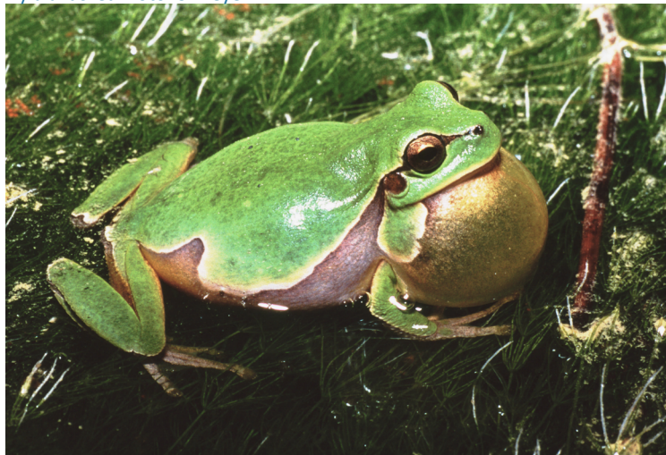
Hyla arborea .

culture che si visitano. Per molti, la semplice conoscenza dell'esistenza di una specie è un buon motivo di protezione e conservazione, indipendentemente dall'opportunità di poterla osservare o fotografare: è il cosiddetto valore di esistenza.