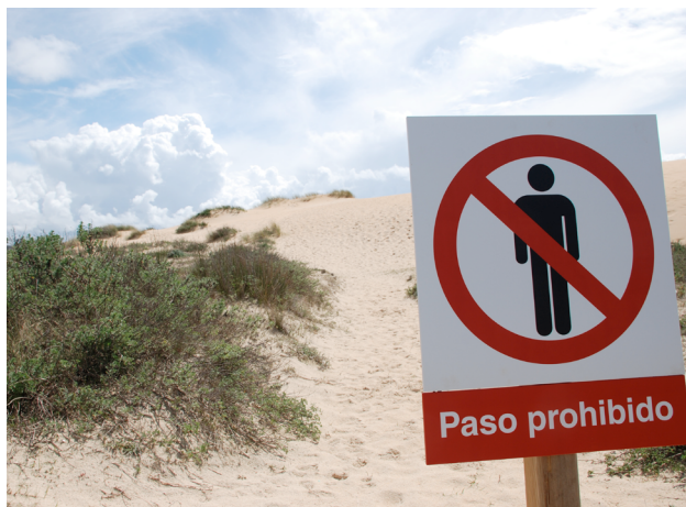
Accesso vietato as una riserva naturale vicino Vigo, Spagna

porzioni isolate e la migrazione è impedita da aree intermedie, alcune specie possono profondamente risentire di catastrofi ambientali come cattivo tempo oppure epidemie di malattie. Inoltre, potrebbero non incrociarsi e divenire vulnerabili da difetti genetici.